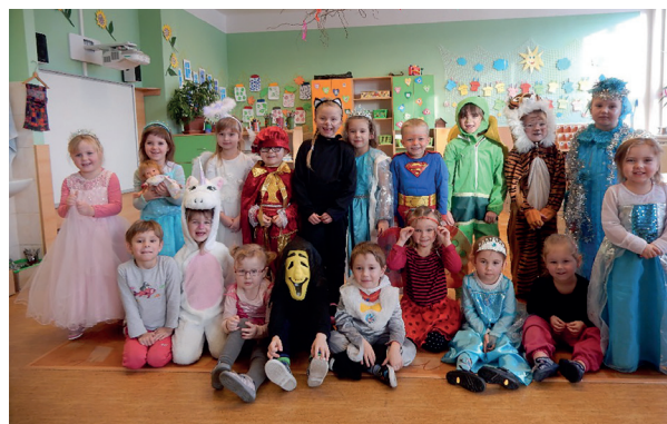
karneval ve školce