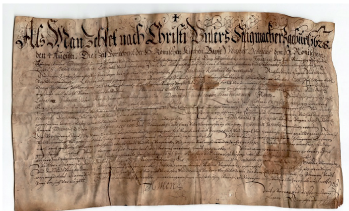
listina z roku 1628