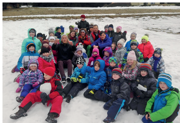
společný lyžařský výcvik dětí z MŠ a ZŠ spolu s instruktory