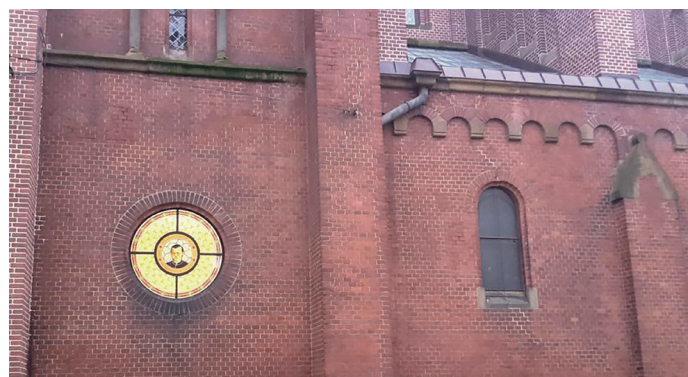
vitráž Engelmara Unzeitiga je k vidění v kostele Sv. Josefa ve Svitavách