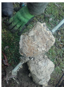
Takto vypadá plovák a čidlo zanešené tukem z domácnosti v jedné kanalizační šachtě

Letos v srpnu obec zakoupila nízkotlakou cisternu včetně tlakového mytí v kontejnerovém provedení pro vozidlo Multicar. Asi většina z Vás postřehla pohyb cisterny po obci. V rámci údržby kanalizačních šachet je nutno tyto šachty jedenkrát v roce očistit, hlavně plováky a čidla uvnitř. Je podivné, když najdeme některé šachty téměř čisté a na druhou stranu úplně tzv. „zarostlé“. Hlavní důvod je, jak se ke kanalizaci chováme. Každý kdo se na kanalizaci připojí, podepsal Smlouvu o odvádění a čištění odpadní vody a její součástí je Provozní řád, kde se uvádí, co do domovní čerpací stanice tlakové kanalizace nelze vypouštět. Největší problémy a poruchy jsou z důvodu vypouštění živočišných a rostlinných tuků a pružných materiálů – vlhčené ubrousky. Pokud bude docházet k opakovaným závadám na čerpadle a technologii šachty nedodržením zásad, budou po majiteli připojené nemovitosti požadovány úhrady nákladů spojených s odstraněním těchto závad. Děkujeme všem, kdo do kanalizační šachty vypouští jen to, co tam patří.