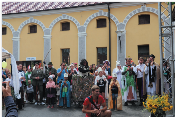
představení společenského života v obci