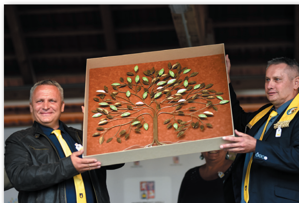
putovní cena pro vítěze