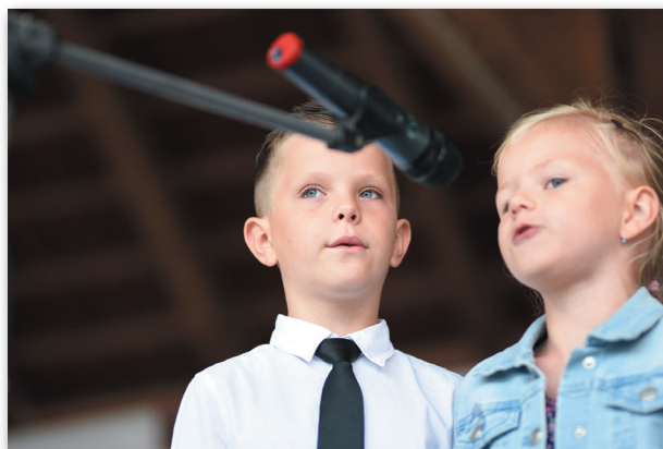
vyhlášení zahájily děti z MŠ