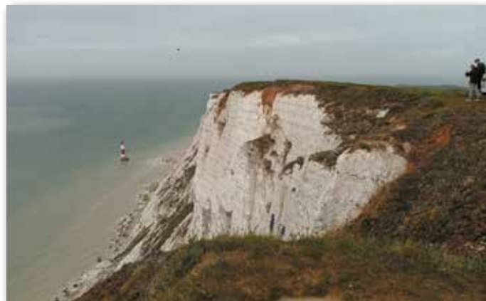
Útesy Beachy Head

Krásné prázdniny a příjemně prožitou dovolenou přejí všichni zaměstnanci školy.