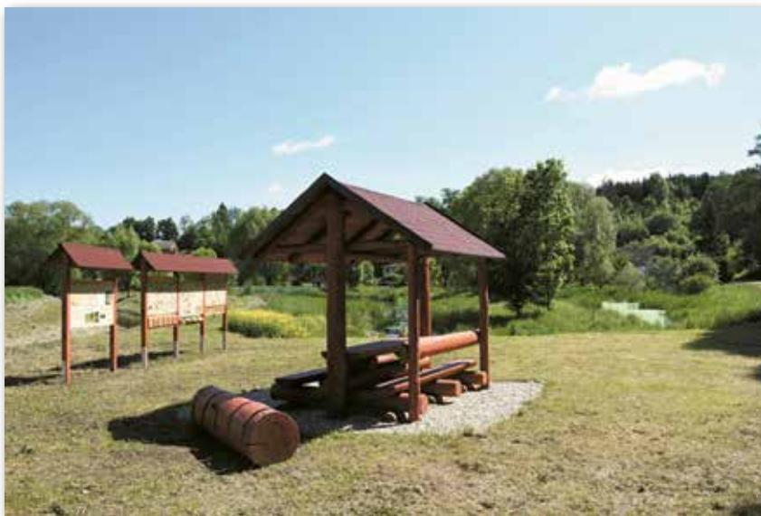
Odpočinkové místo a naučná stezka