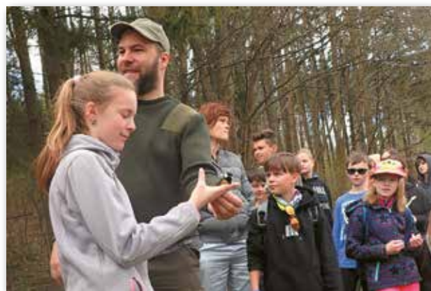
žáci naší ZŠ při programu u rybníčků