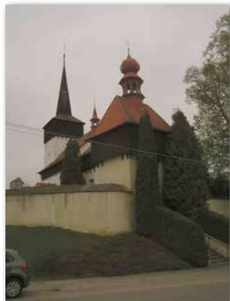
Kostel. sv. Barbory v Baníně