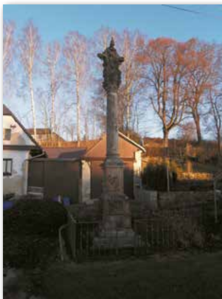
Sloup Nejsvětější Trojice