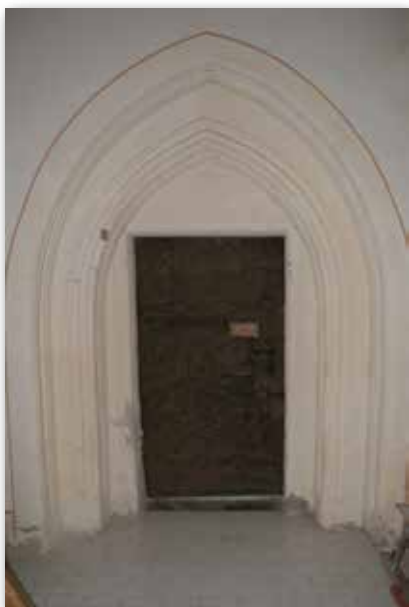
Gotický portál v kostele sv. Kateřiny v Hradci n. Svit.