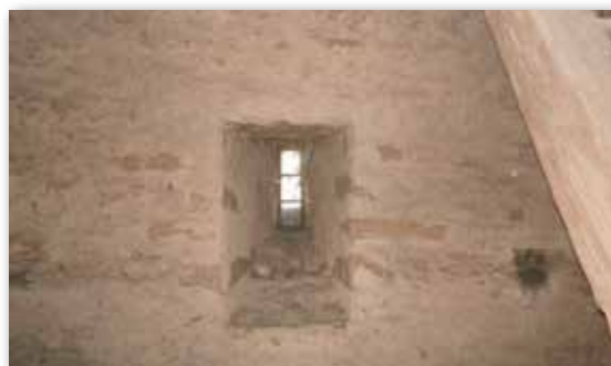
Střílna ve věži kostela Sv. Kateřiny