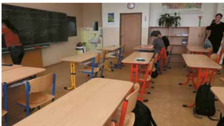
výškově nastavitelné lavice