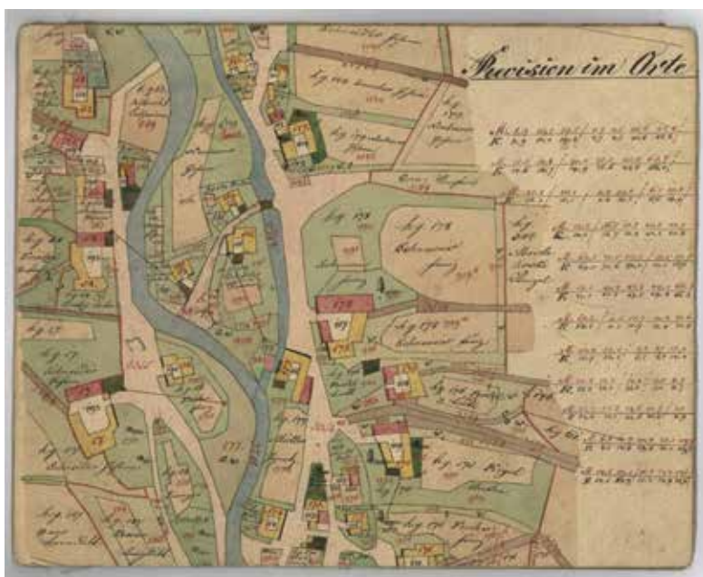
„Müllerův mlýn“ na katastrální mapě obce z roku 1835