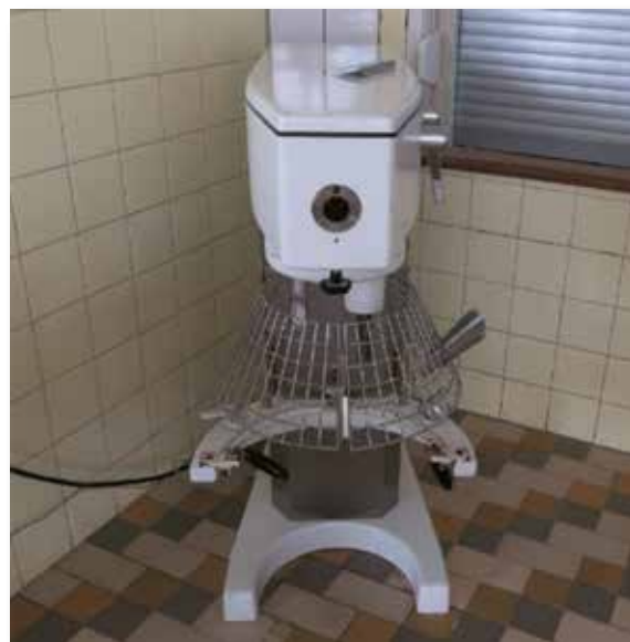
univerzální šlehací stroj do kuchyně