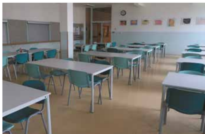
nové vybavení jídelny