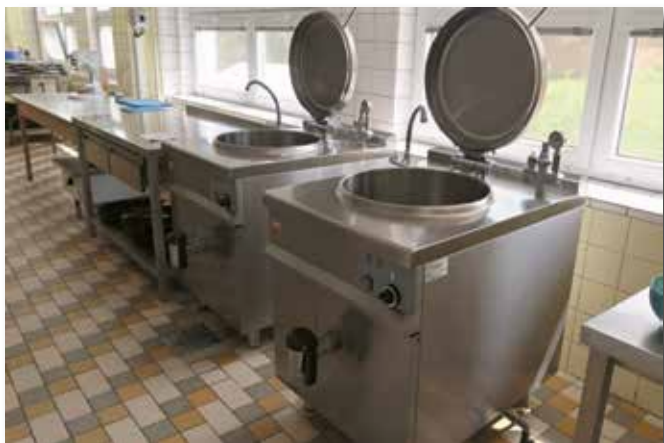
elektrické kotle do kuchyně