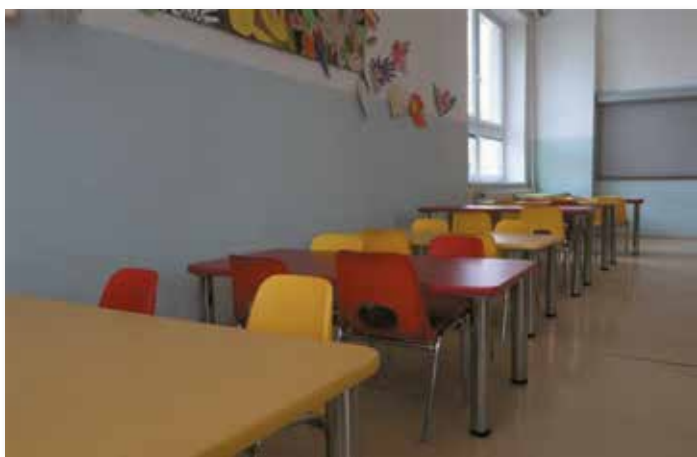
nové vybavení jídelny