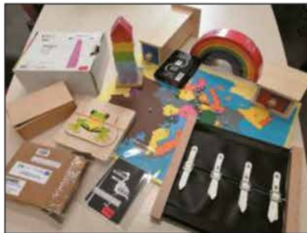
2 - Montessori

V roce vznikly tzv. tematické kufříky se zaměřením na matematickou a čtenářskou pregramotnost, a dále montessori pomůcky, o které je velký zájem.