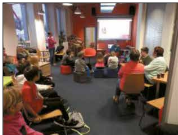
4 - Aktivita Fantasy klub

Veškeré aktivity projektu jsou připraveny pro všechny městské i venkovské školy, školky. Co se chystá v letošním roce, se můžete zeptat manažerky projektu: Stanislava Vaněčková, vaneckova@massvitava.cz