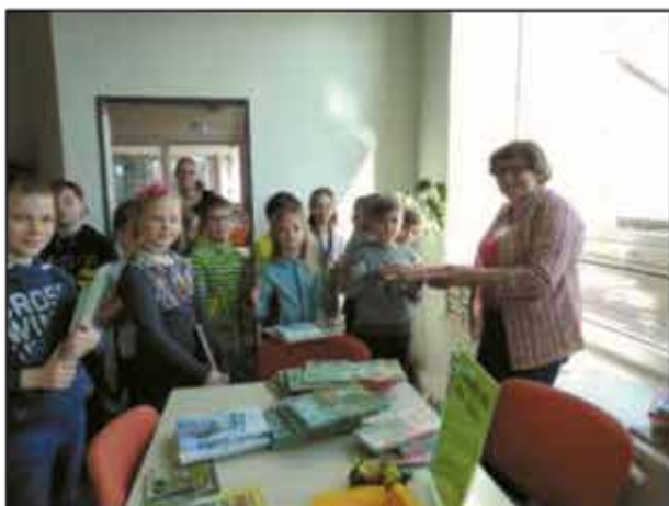
3 - Aktivita Kufr plný knih