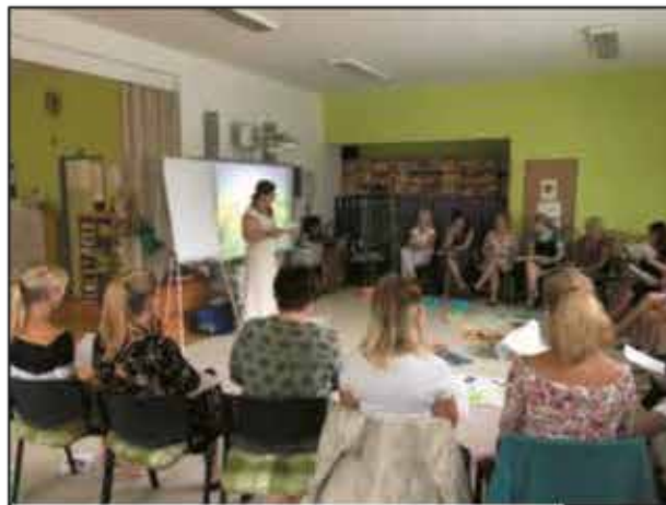
1 - Letní škola