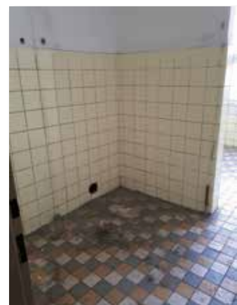
foto před rekonstrukcí