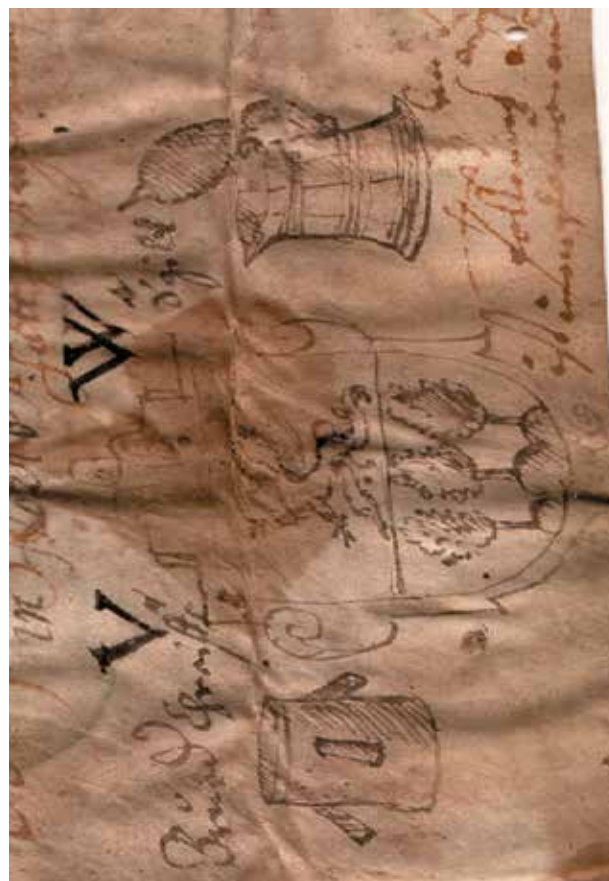
šlechtický erb Veita Wenera