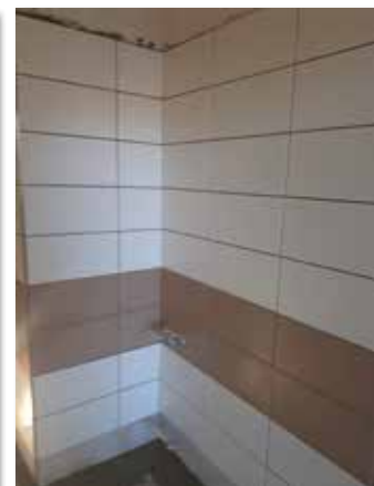
foto v průběhu rekonstrukce