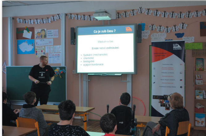
přednáška - Chemie v přímém přenosu