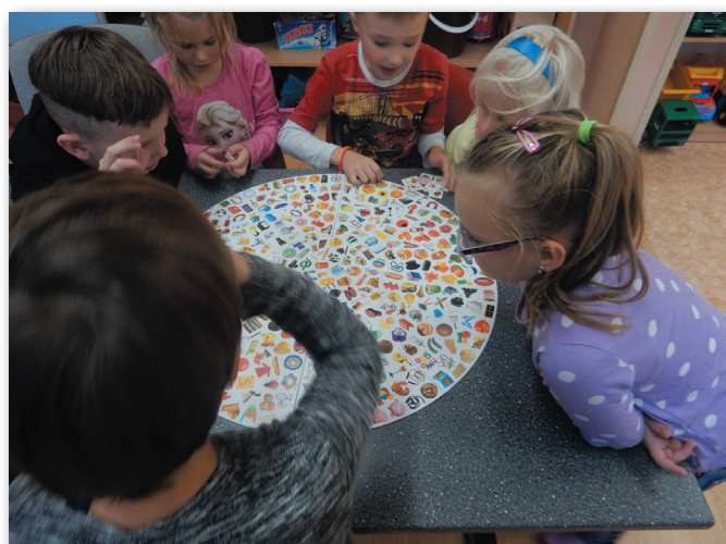
aktivita školní družiny